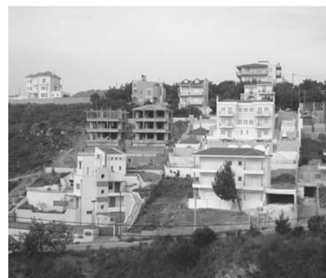
Αττική - σ.δ. 0,20, κάλυψη 10%

χωρίς αυτό να σημαίνει ότι επεκτάθηκε στο σύνολο των συναδέλφων, που είχαν τριπλασιαστεί μέσα σε δύο χρόνια και σε μεγάλο ποσοστό ζούσαν πουλώντας την υπογραφή τους σε συναδέλφους (για φοροαποφυγή), σε πολιτικούς μηχανικούς, σε υπομηχανικούς και σε εργολάβους.