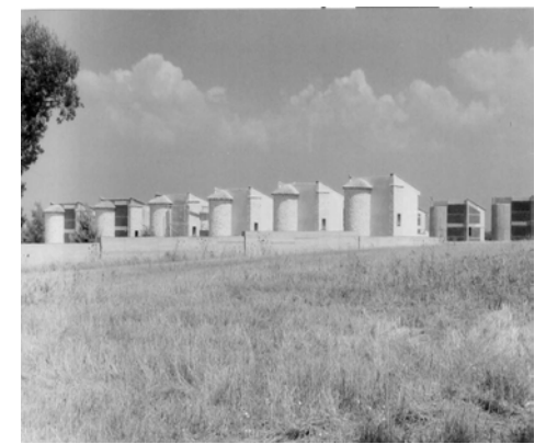
Χαλκιδική - εκτός σχεδίου

Η άθλια αυτή κατάσταση, πέρα από τα ζητήματα διαφθοράς που περιέχει, συμπαρασύρει και την δημόσια εικόνα του αρχιτέκτονα, από την άποψη ότι ο κλάδος αναλαμβάνει πολύ μεγάλο μέρος των ευθυνών για το αποτέλεσμα, απαλλάσσοντας ταυτόχρονα από αυτές το κράτος, αφού οι ΕΠΑΕ είναι όργανα που αποτελούνται αποκλειστικά από συναδέλφους.