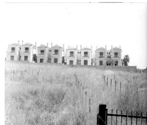
Χαλκιδική - εκτός σχεδίου

Είναι γεγονός ότι υπάρχουν ορισμένες περιπτώσεις επιτροπών με τέτοια προσφορά, ακόμα και περιπτώσεις συναδέλφων που έχουν κάνει πραγματικό αγώνα μέσα σ' αυτές. Η αναγνώριση αυτής της προσφοράς δεν πρέπει να συγκαλύψει αυτό που χαρακτηρίζει τον κανόνα: Την αναποτελεσματικότητα . Αυτή είναι πιο φανερή στις περιοχές που ελέγχονται καθ' ολοκληρίαν από τις ΕΠΑΕ (π.χ. εκτός σχεδίου, προστατευόμενες περιοχές κ.λ.π.).