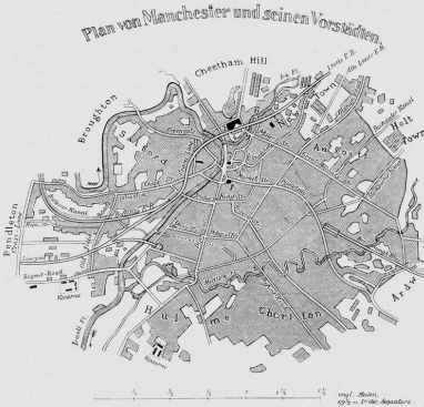
ΕΚΔΟΣΕΙΣ ΤΥΠΟΕΚΔΟΤΙΚΗ ΑΘΗΝΑ 2003